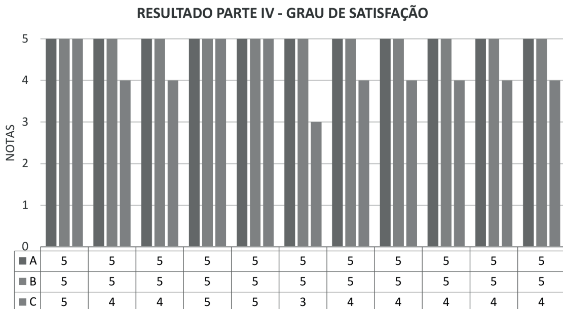
Gráfico 3 – Grau de satisfação com os serviços prestados pela auditoria interna

grau de confiabilidade das informações geradas pela auditoria interna?; H) Qual o grau de impacto que as ações de auditoria trazem a cada setor, após ser auditado?; I) Para a gestão, as análises e comprovações levantadas pela auditoria realizada na empresa, nos últimos 5 anos, foram satisfatórias para um melhor gerenciamento dos controles internos?; J) Qual o grau de impacto no planejamento organizacional, após os resultados obtidos pela auditoria interna?; K) As providências sugeridas pela auditoria interna, em relação às não conformidades encontradas, foram tomadas?; L) Qual o grau de eficácia das providências sugeridas pela auditoria e que foram implementadas pela empresa?; M) A empresa está satisfeita com a aplicabilidade da auditoria interna na revisão e na avaliação da eficácia dos controles internos?; N) A empresa está satisfeita com o resultado da avaliação do cumprimento das normas e o desempenho das atividades de cada setor, levantado pela auditoria?; O) A empresa está satisfeita com os resultados alcançados pela auditoria na detecção e na prevenção de erros e fraudes?; P) A empresa está satisfeita com as informações geradas para o apoio à tomada de decisão? P resultado está apresentado no Gráfico 3: