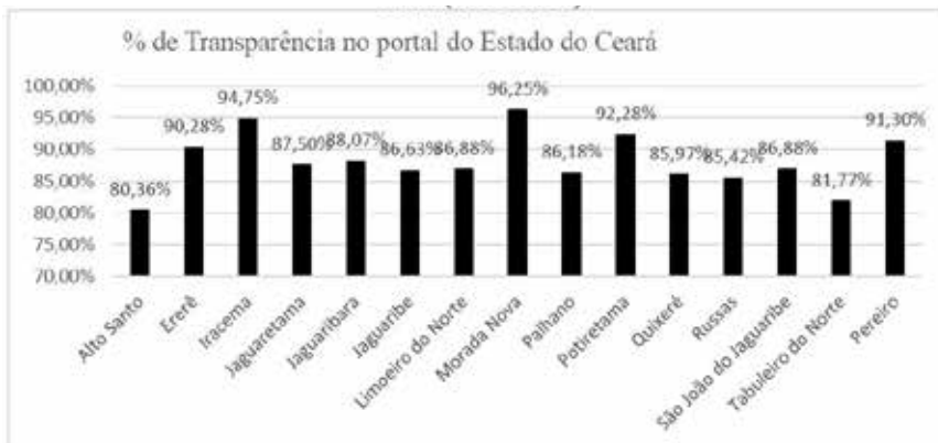
Gráfico 1 – Análise do Nível de Transparência dos Convênios no Portal do Estado do Ceará (2021–2024)