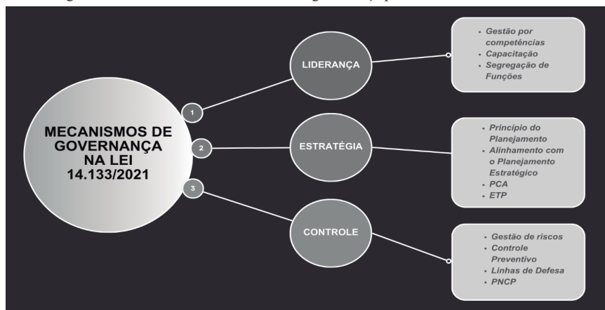
Figura 3 – Síntese dos três mecanismos de governança presentes Lei n.º 14.133/2021

públicas, proporcionando maior clareza e tornando essa área mais estratégica para a administração pública. Conforme Dias e Cairo (2014), a governança pública está avançando em direção ao desenvolvimento econômico sustentável, melhorando o processo decisório democrático e garantindo transparência, o que é fundamental para as políticas públicas. A figura abaixo sintetiza como os três mecanismos de governança aparecem na Lei n.º 14.133/2021.